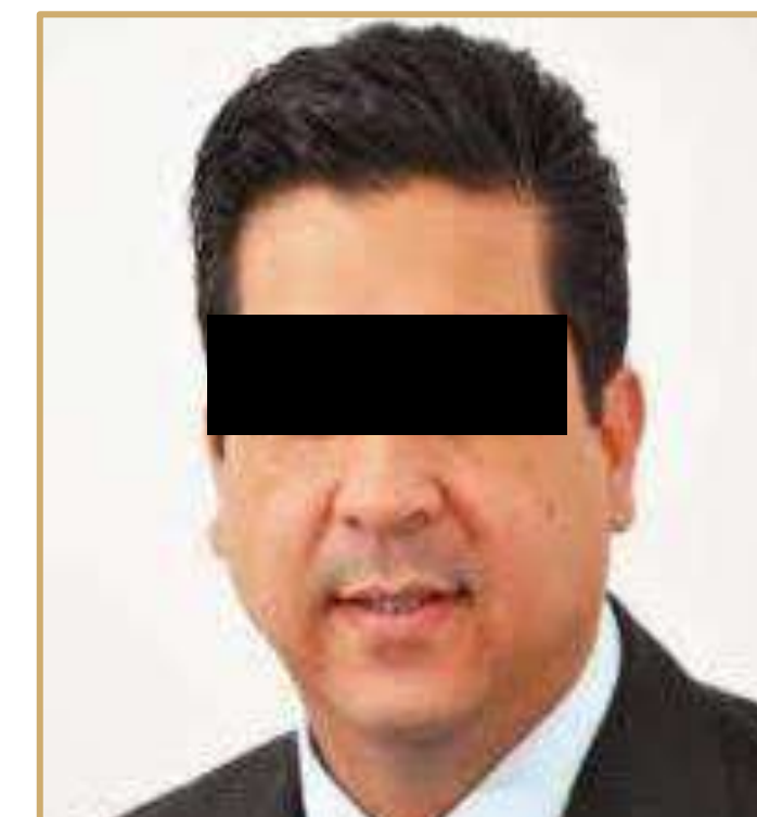
Francisco Javier “N”

Otro de los efectos de la suspensión es que no pierda sus derechos político-electorales y no se le declare prófugo de la justicia .